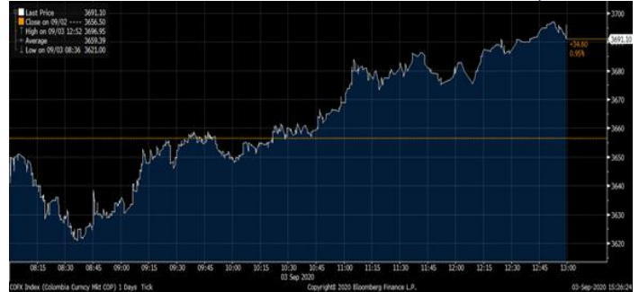
Gráfica 3. Precios de Cotización Intradía del Dólar Spot