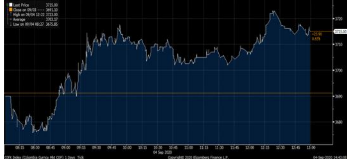
Gráfica 2. Precios de Cotización Intradía del Dólar Spot