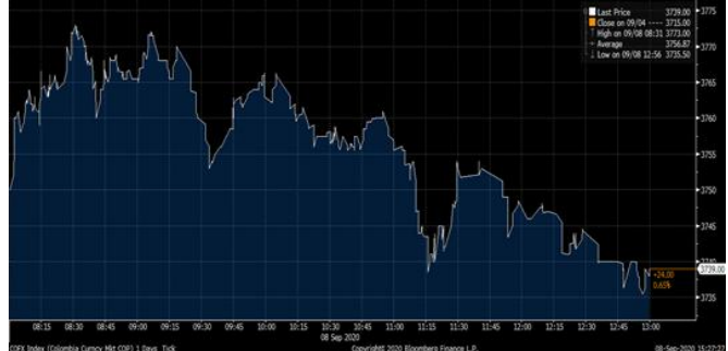
Gráfica 2. Precios de Cotización Intradía del Dólar Spot