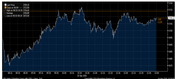
Gráfica 2. Precios de Cotización Intradía del Dólar Spot