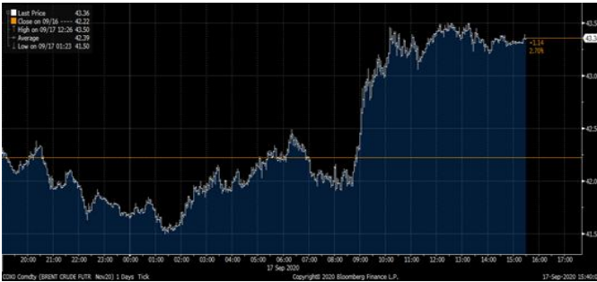
Gráfica 1. Precios de negociación de Petróleo Brent