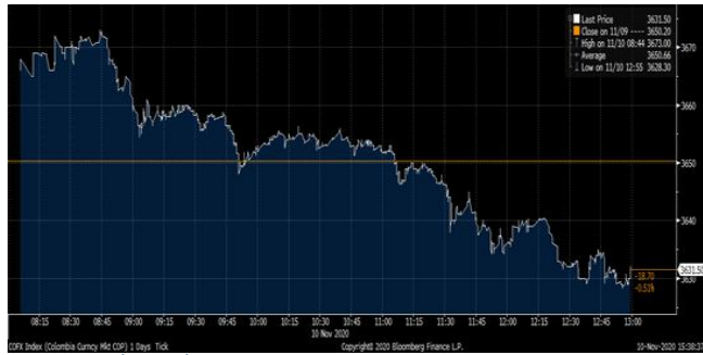
Gráfica 2. Precios de Cotización Intradía del Dólar Spot