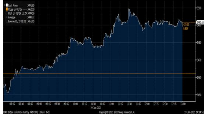
Gráfica 2. Precios de Cotización Intradía del Dólar Spot