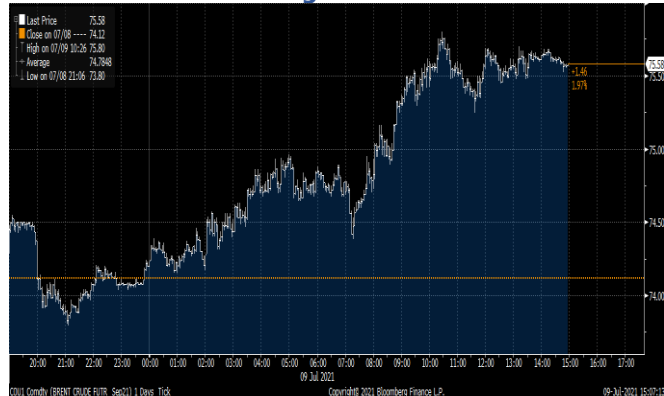
Gráfica 1. Precios de negociación de Petróleo Brent