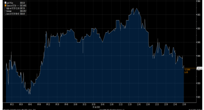
Gráfica 2. Precios de Cotización Intradía del Dólar Spot