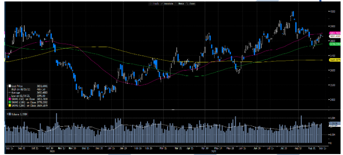
Gráfica 2. Precios de Cotización Intradía del Dólar Spot