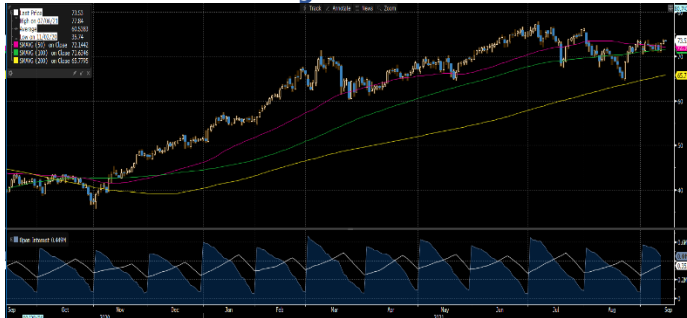
Gráfica 1. Precios de negociación de Petróleo Brent