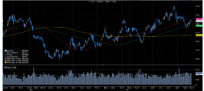
Gráfica 2. Precios de Cotización Intradía del Dólar Spot