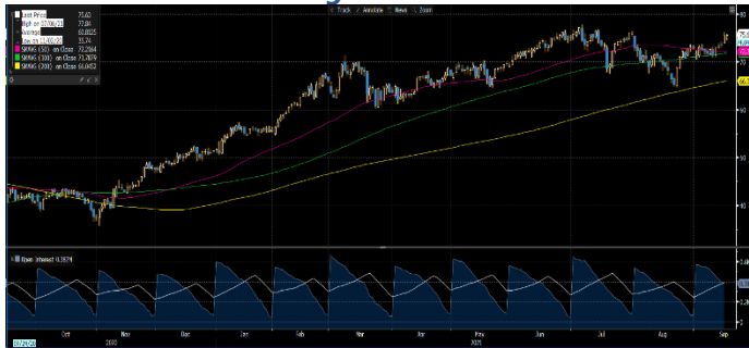
Gráfica 1. Precios de negociación de Petróleo Brent