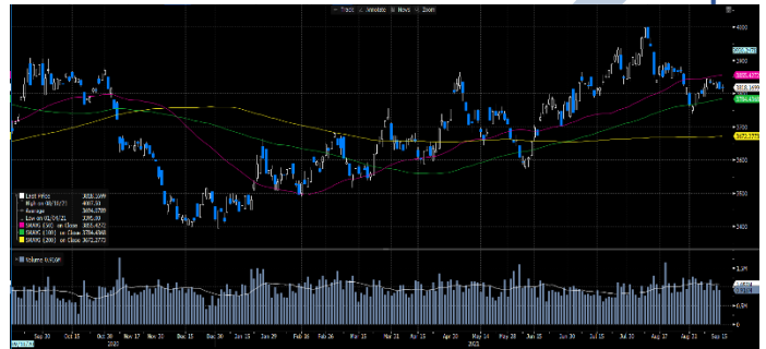
Gráfica 2. Precios de Cotización Intradía del Dólar Spot