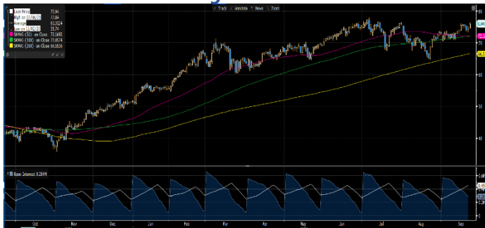
Gráfica 1. Precios de negociación de Petróleo Brent