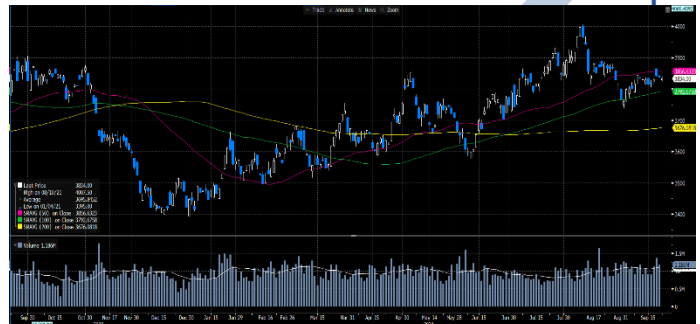
Gráfica 2. Precios de Cotización Intradía del Dólar Spot