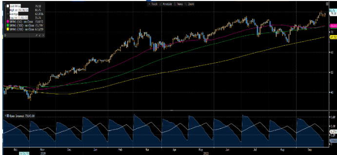
Gráfica 1. Precios de negociación de Petróleo Brent