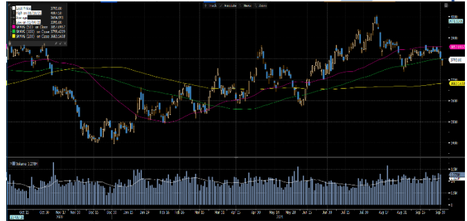
Gráfica 2. Precios de Cotización Intradía del Dólar Spot