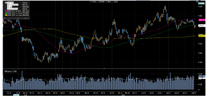
Gráfica 2. Precios de Cotización Intradía del Dólar Spot