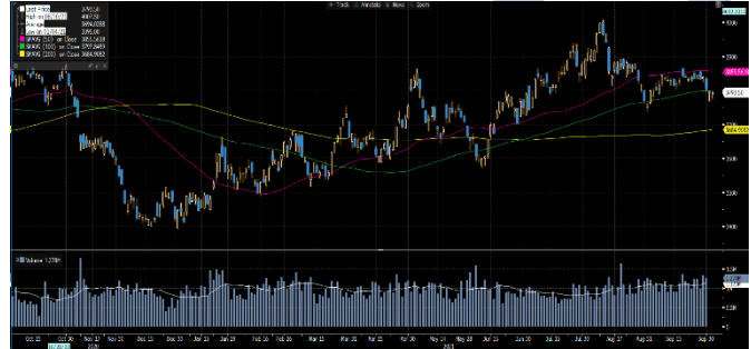
Gráfica 2. Precios de Cotización Intradía del Dólar Spot