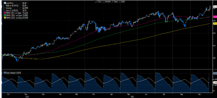
Gráfica 1. Precios de negociación de Petróleo Brent