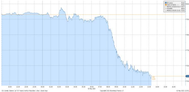
Gráfica 1. Precios de negociación de Petróleo Brent