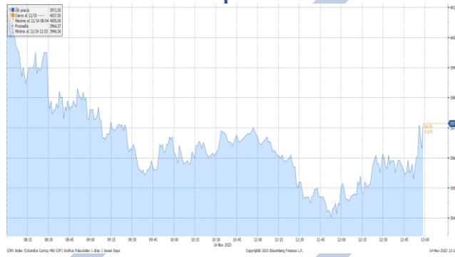
Gráfica 2. Precios de Cotización Intradía del dólar Spot