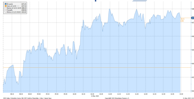
Gráfica 2. Precios de Cotización Intradía del dólar Spot