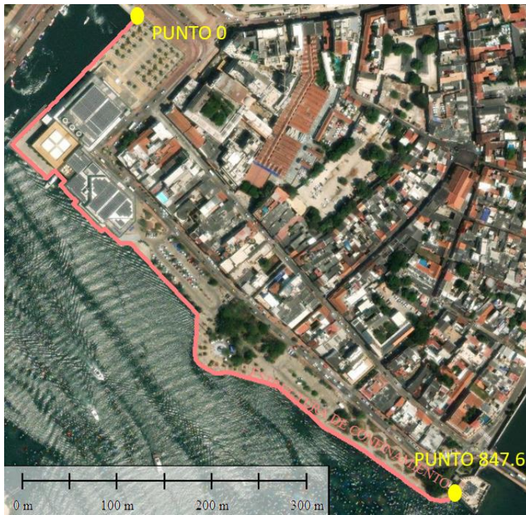
Figure 1. Eje de la estructura de confinamiento y protección del Centro de Convenciones.

En color magenta en la Figure 1, se representa la estructura y el punto de inicio (0m) y el punto final (847.6m). Es importante manifestar que la información que lleva al presente trabajo, se encuentra debidamente georreferenciada considerando Datum Oficial Colombiano. Sistema de coordenadas MAGNA SIRGAS ORIGEN UNICO.