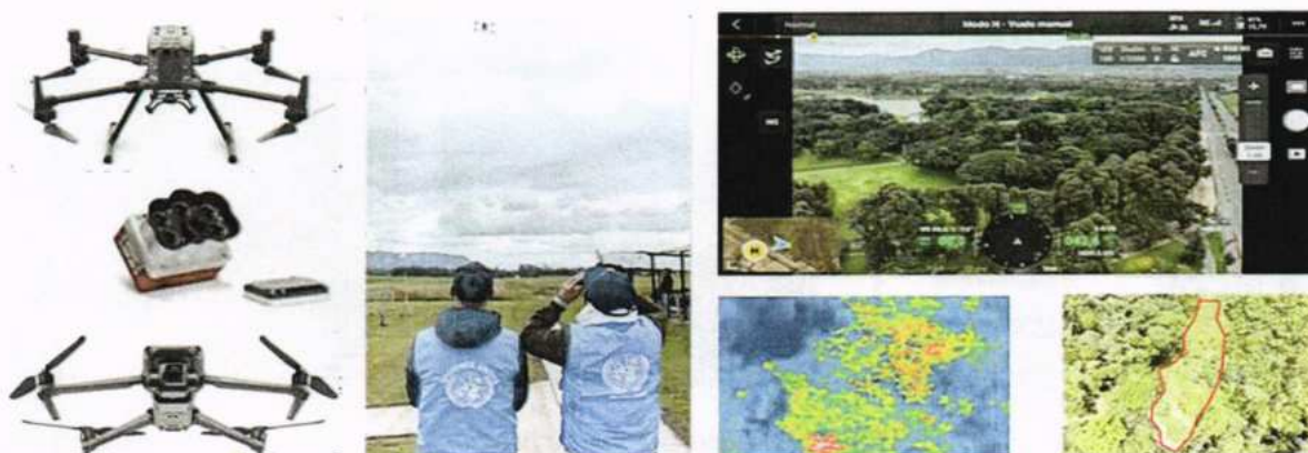
Figura 3. Monitoreo con drones