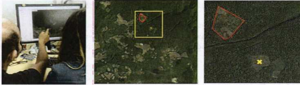
Figura 1. Identificación digital de los lotes con compromiso de erradicación