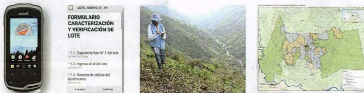
Figura 2. Localización de predios